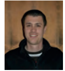
Presse/Medien/Information Hans Rothenberger

Einige eurer E-Mail-Adressen, die im Newsletter-System eingetragen sind, sind leider nicht mehr aktuell und daher bekommt ihr unseren Newsletter nicht. Bitte tragt euch mit der neuen Adresse auf unserer Webseite www.tc-buchs.ch (unter Newsletter) neu ein, damit Ihr immer aktuell informiert seid.